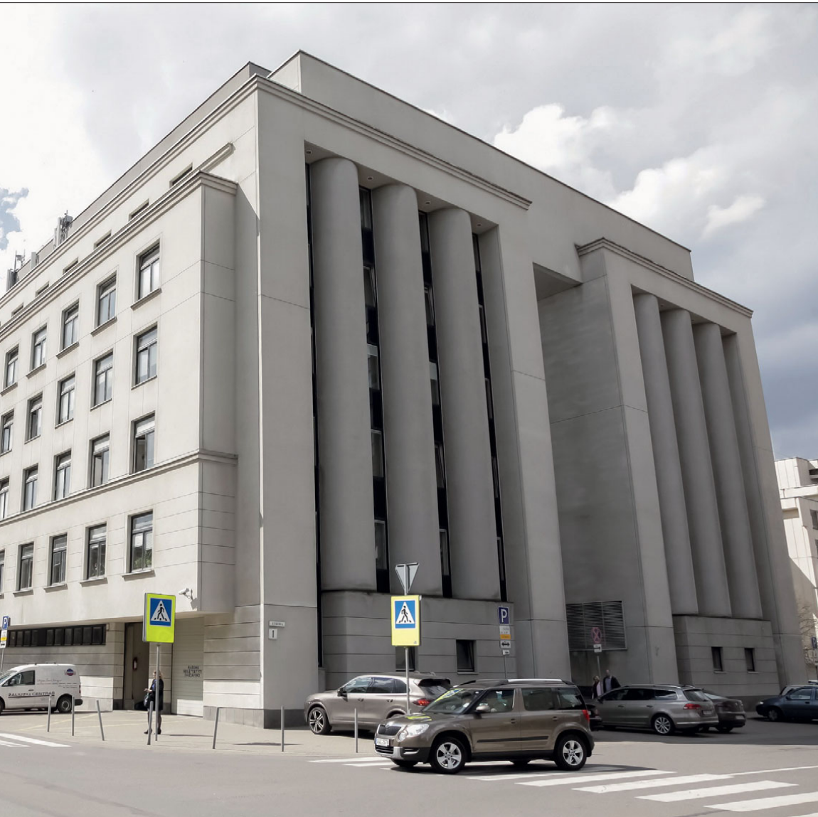
Per aštuonerius metus trukusią rekonstrukciją nacionalinė biblioteka prarado didžiąją dalį skaitytojų, greičiausiai daugelis jų nebegriš. Bet ateis tie, kuriuos domina kūrybinės, su verslo mokymais, konsultacijomis susijusios veiklos

Biblioteką reikia matyti valstybės kultūros, informacijos, mokslo politikos kontekste. Tik ar mes ją turime adekvačią? Norėtume išvengti klaidos, kuri gali būti padaroma kuriant labai galingas infrastruktūras ir kartu neturint joms užpildyti pakankamo intelektualinio potencialo. Šiuo metu Lietuvoje sukurta infrastruktūra gali aprūpinti 50 tūkst. besimokančiųjų, jų pačių šiandien tėra 30 tūkst. Perspektyvoje, tęsiantis emigracijai, studijuojančiųjų šalies aukštosiose mokyklose bus dar mažiau. Žiūrėdami į tai, kas vyksta su Lietuva, esame priversti, kaip sakė Vytautas Mačernis, išlikti dūžtančiose formose.